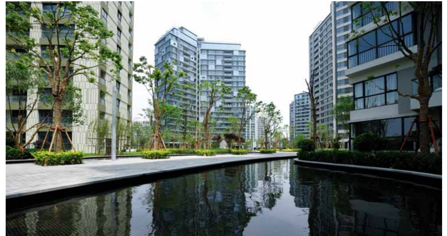
Torri Residenziali Royal Garden, Shanghai, 2012 - project by Peia Associati

From architecture to final furniture details: the Italian Made to Measure design arrives in Shanghai